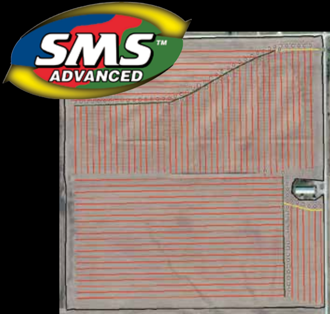
Progetto completo di un drenaggio tubolare con dimensionamenti appropriati di tutti i mezzi tecnici necessari

Il modulo SMS Water Management elimina ogni dubbio nella progettazione dei drenaggi.